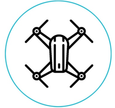
Drone Gesture control