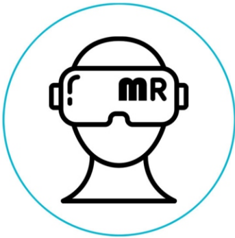
Native HCI (Human Computer interaction)